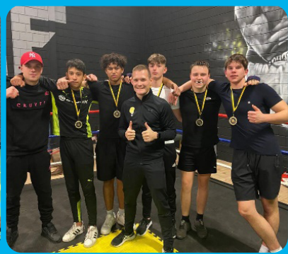
Speciaal maken van de prestatie