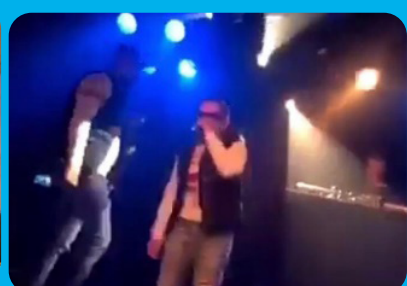
Speciaal maken van de prestatie